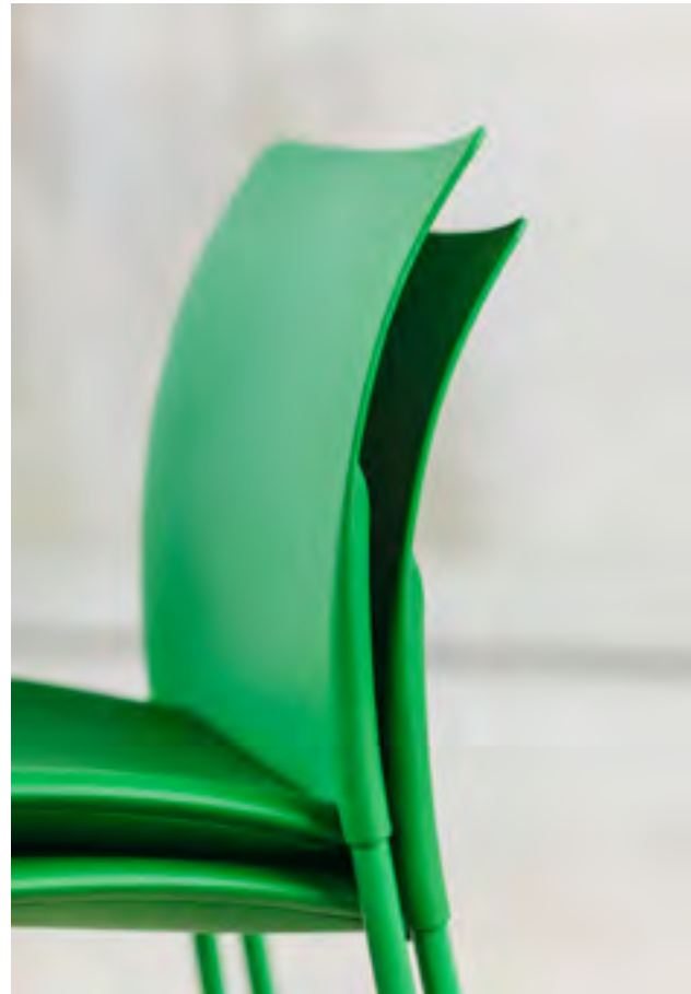
Global chair w/o arms (ref. 0601) in monochrome special color.