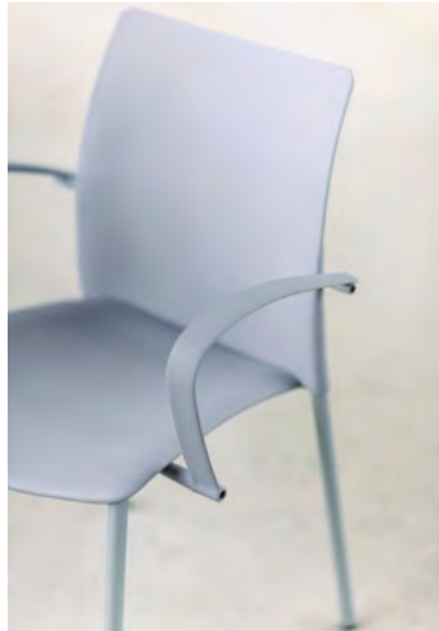
Global chair w/ arms (ref. 0600) in monochrome RAL 7004.

In the Global line, special thought has been given to the impact suffered by the chairs through constant and heavy use, with materials and build solutions chosen to give maximum durability. The family includes seat versions with and without arms, an office and beam base. An installable writing tablet is available as well as a connector option.