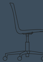
OFFICE W 612 H 815/945