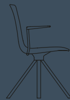
SPIN WINGARMS W 581,5 H 860 D 525