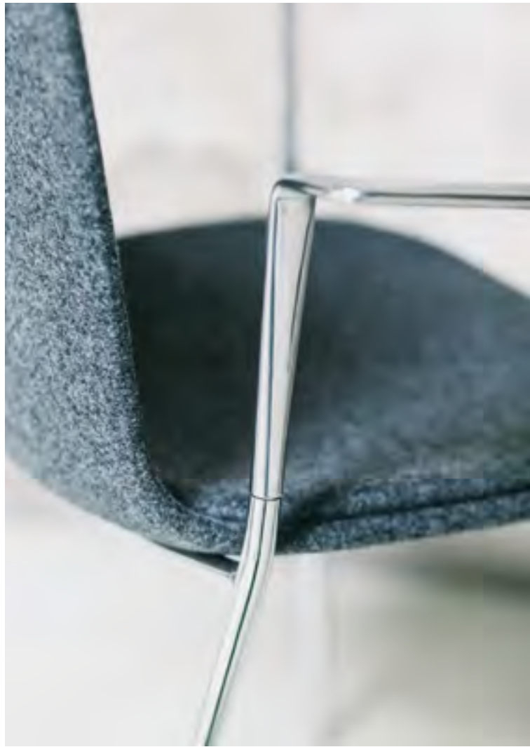
High Lottus chairs (ref. 6200), in Chrome structure and fully upholstered in Divina Melange 120, 130, 133 and 170.

Amenable in design and character; ideal for contemporary working and learning environments.