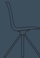
SPIN W 581,5 H 860 D 525