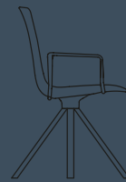
SPIN ARMCHAIR W 581,5 H 860 D 525