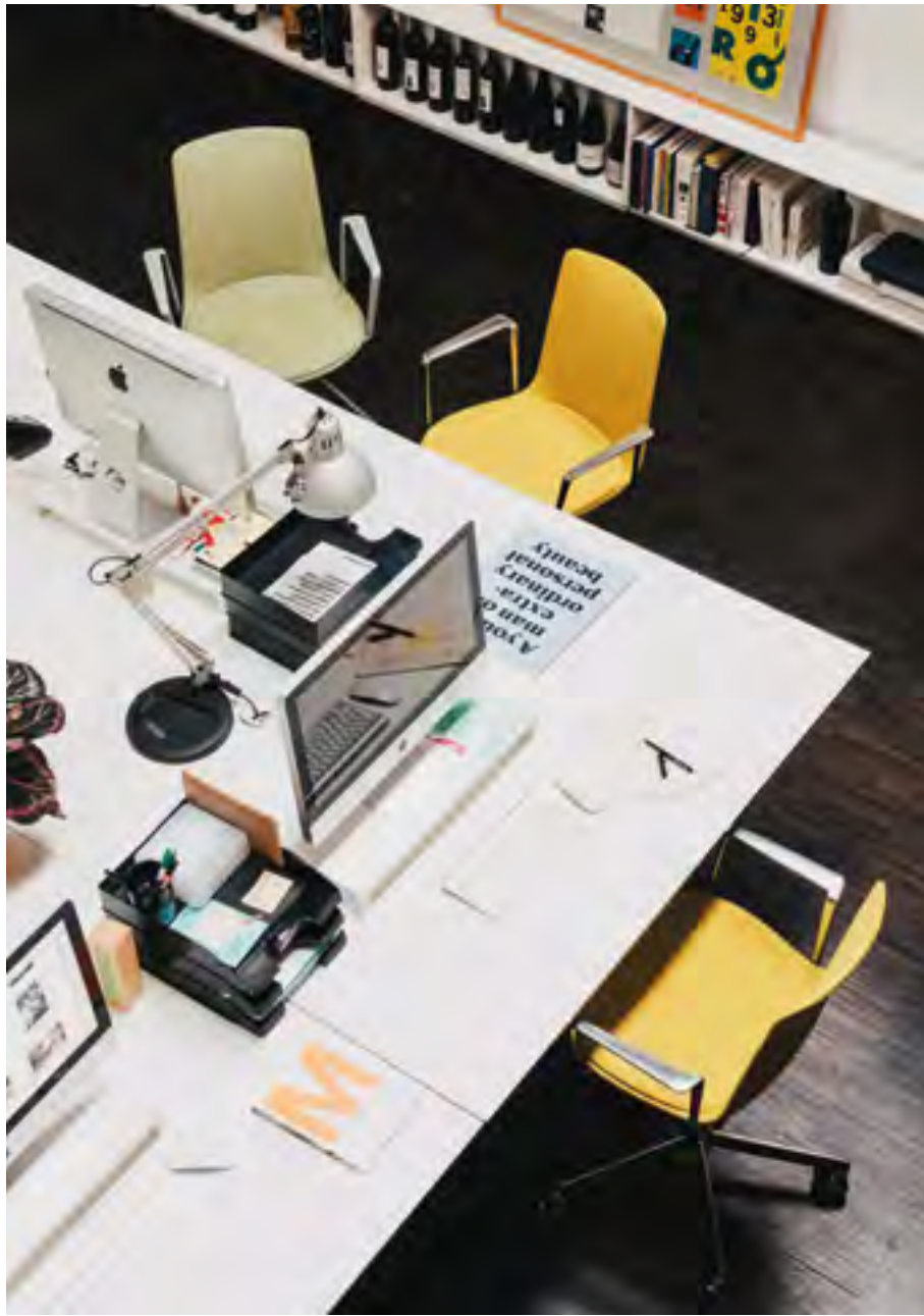
Lottus High office chair family (ref. 6406) with polished aluminium base and arms, and fully upholstered in Crisp 4202.