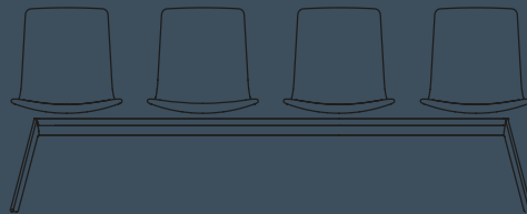
BENCH ARMCHAIR 2/3/4/5 PLACES W 1034/1604/2174/ H 775 D 516