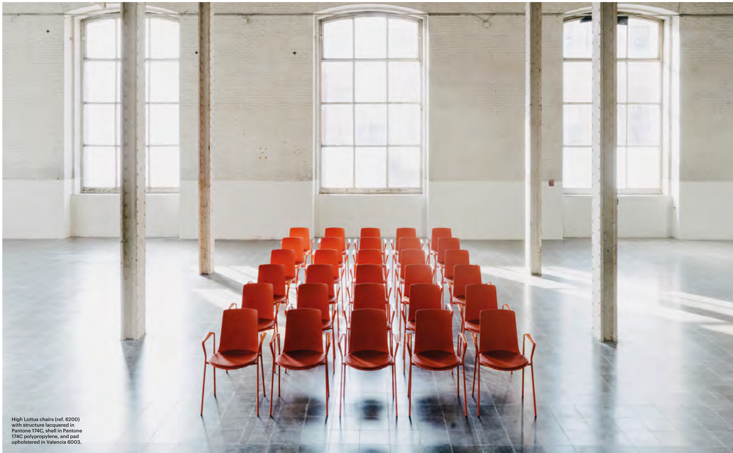
High Lottus chairs (ref. 6200) with structure lacquered in Pantone 174C, shell in Pantone 174C polypropylene, and pad upholstered in Valencia 6003.