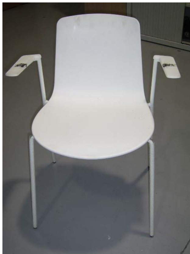
Chaise 4 pieds avec accotoirs

Le 29 mars 2010, CIDEMCO a reçu de l'entreprise ENEA-EREDU S. COOP, une chaise de la série « LOTTUS » présentant les caractéristiques suivantes :