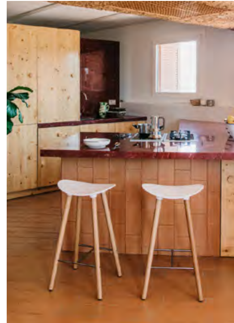
Coma Wood (ref. 2095), in oak legs and upholstered in Hallingdal 596 and 526 with LTS System (ref. 4972).

Las opciones de tapicería ofrecen una sensación más cálida, sin renunciar al minimalismo de Coma.