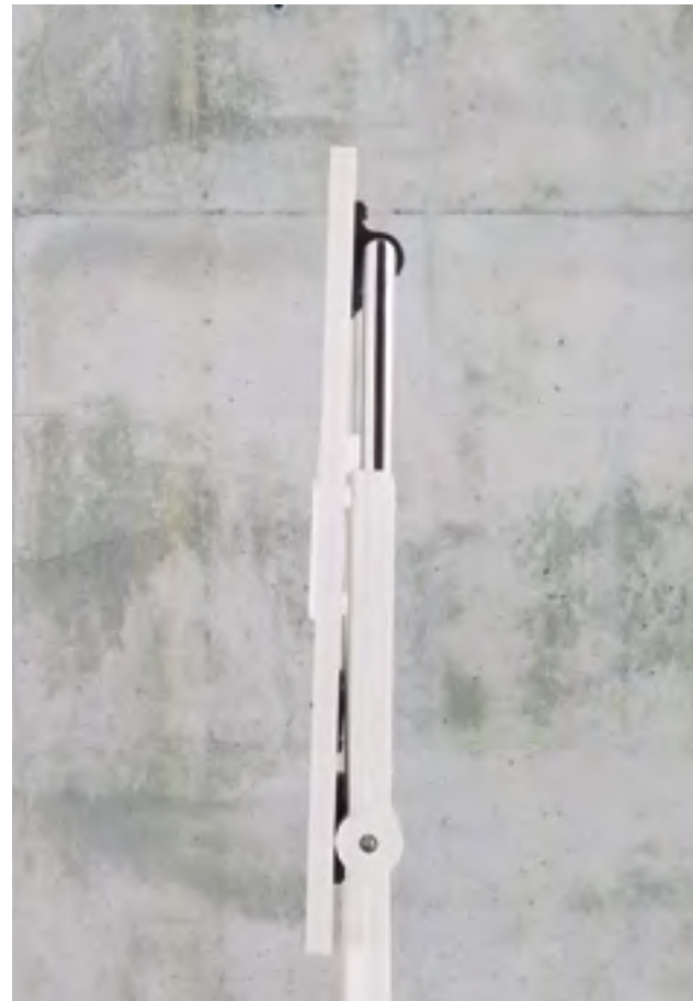
Folio table (ref. 6010) with a RAL 9016 lacquered structure and top in White melamine.