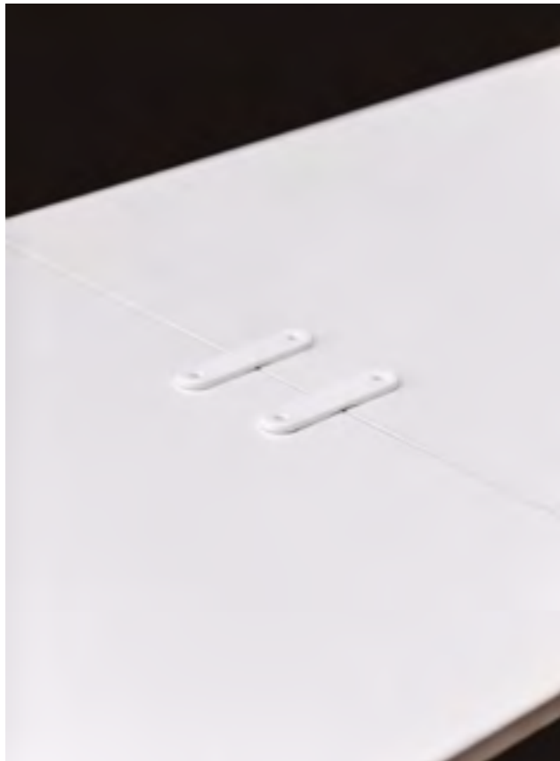
Table connectors in RAL 9016 polypropylene.

Its flexibility and manageability means anybody can fold and move the Folio tables easily with one hand, stack them in the desired place of storage, or transport them easily on the optional trolley. The outcome is huge savings in assembly, disassembly and storage. It also come with its own transport trolley and other accessories.