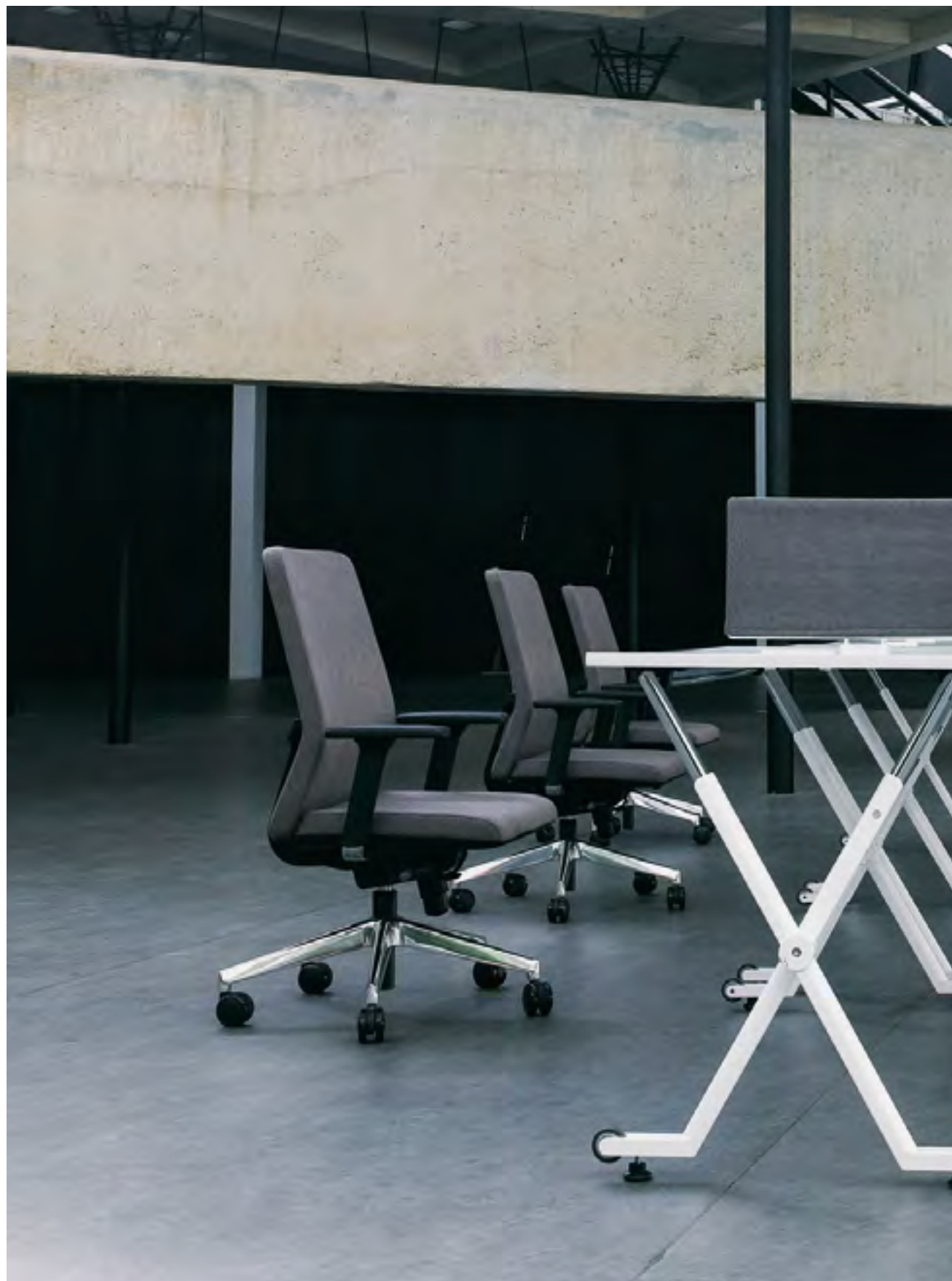
Movado chair (ref. 50082) fully upholstered in Urban YN086 with 3D arms used with Folio table (ref. 6010).