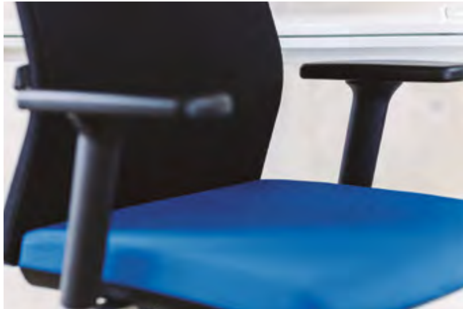
Movado chair (ref. 5008) with 3D arms, seat upholstered in Xtreme Plus YSO35 and back rest in Black technical mesh.

The Movado family is the versatile and comfortable solution for work environments, given its exceptional functional adaptability and its many choices of finishes. Its accessories permit lumbar adjustment, variable seat depth and height, adjustable armrests in four sizes as well as synchronized backrest and seat recline.