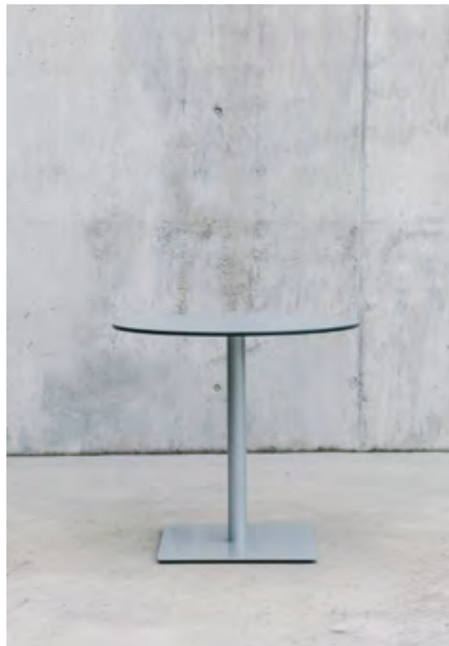
Punto table (ref. 2303), with a bright RAL 7004 lacquered structure and special top in Grey HPL.