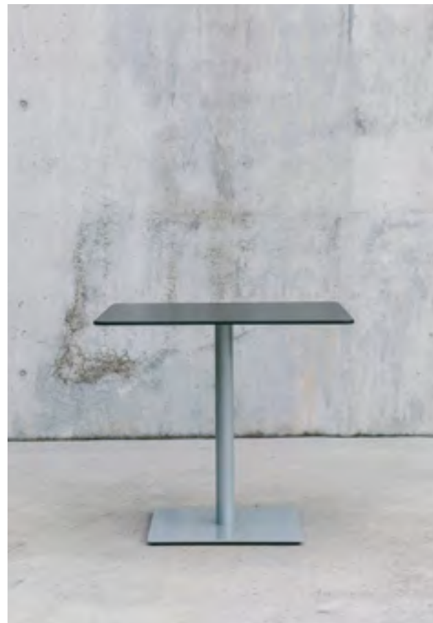
Punto table (ref. 2303), with a bright RAL 7004 lacquered structure and top in Black HPL.

While its toughness makes it an ideal solution for public use such as in food courts and cafes, the Punto table's three available heights and varied finishing options means it easily adapts to many living and work spaces.