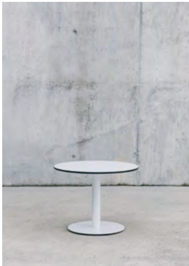
On the top: Punto table (ref. 2309) with RAL 9016 structure and HPL top.