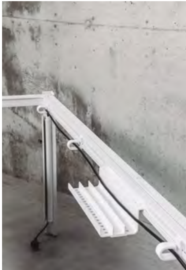
Cable tray, clamp bushing and cable leg, all in RAL 9016 polypropylene.

Way's aluminium structure adds lightness as well as making it easy to combine the tables. The great variety of accessories can be easily incorporated into the table in order to cover multiple office needs. Coming in a wide range of epoxy and lacquered colours, they can also be customised according to individual needs.