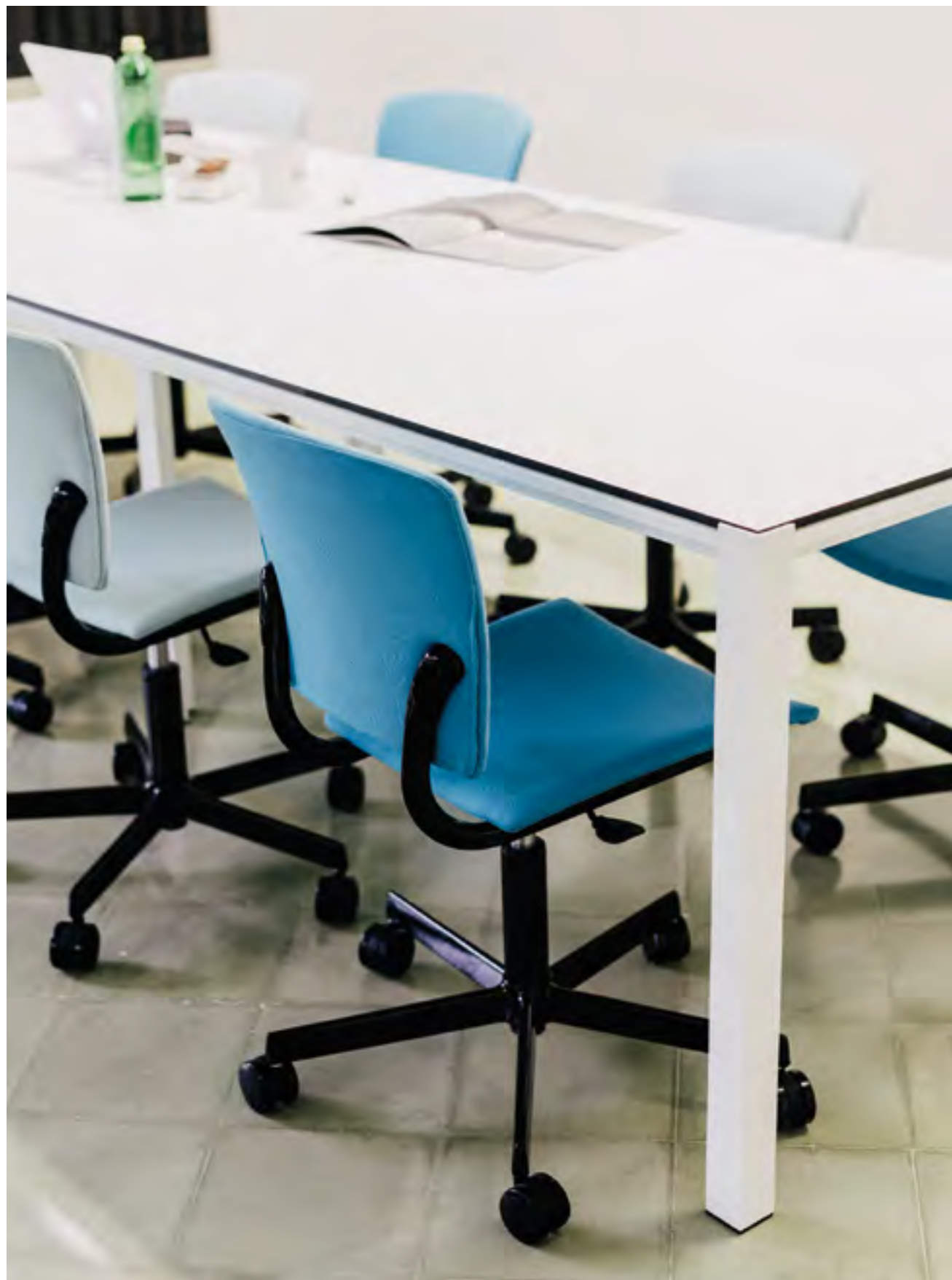
On the left: Eina chairs (ref. 0415) lacquered in RAL 9005 and upholstered in Fame 66133 and 67068. Used with Way.